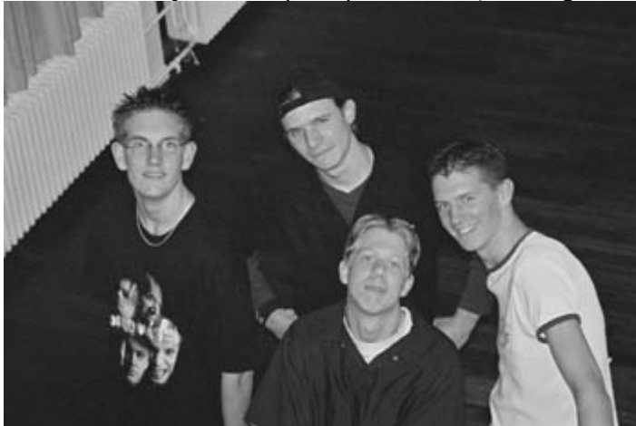
<<< Scatched Ego

Het Straattheaterfestival zal worden afgesloten door de band Scatched Ego met een spetterende rockshow, met covers van verschillende bekende en onbekende bands als De Dijk, Muse en Metallica e.v.a.. Laten we met zijn allen hopen op mooi weer, dan regelen zij dat het muzikaal helemaal goed komt.