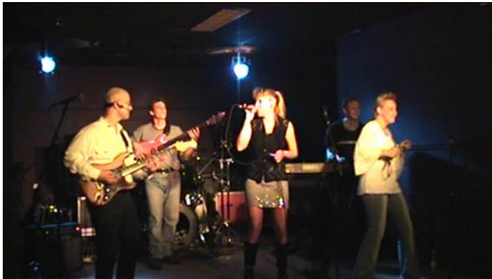
<<< Formatie Pure